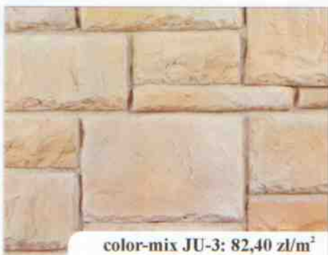
color-mix JU-3: 82,40 zł/m 2