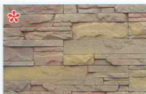
*color-mix CE-7: 114,50 zł/m 2 *color-mix CE-7K: 123,10 zł/m 2