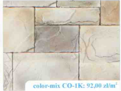
color-mix CO-1K: 92,00 zł/m 2