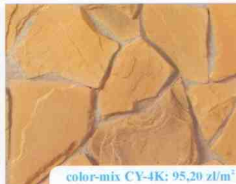
color-mix CY-4K: 95,20 zł/m 2