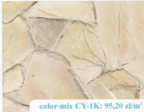
color-mix CY-1K: 95,20 zł/m 2