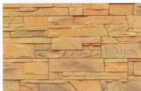
color-mix CE-1: 93,10 zł/m 2 color-mix CE-1K: 99,50 zł/m 2