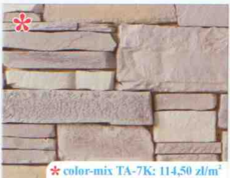
* color-mix TA-7K: 114,50 zł/m 2