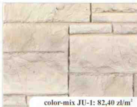
color-mix JU-1: 82,40 zł/m 2