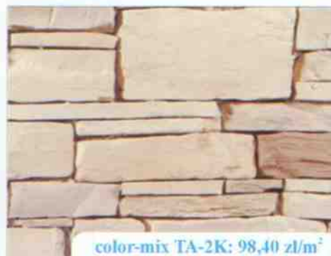
color-mix TA-2K: 98,40 zł/m 2