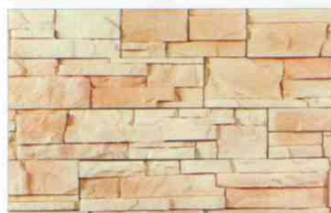
color-mix CE-4: 98,40 zł/m 2 color-mix CE-4K: 104,90 zł/m 2