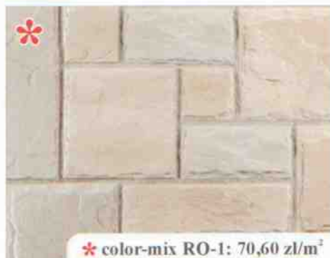
* color-mix RO-1: 70,60 zł/m 2