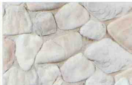
color-mix OV-1: 78,10 zł/m 2