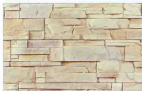
color-mix CE-3: 98,40 zł/m 2 color-mix CE-3K: 104,90 zł/m 2