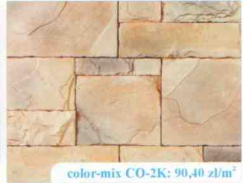
color-mix CO-2K: 90,40 zł/m 2