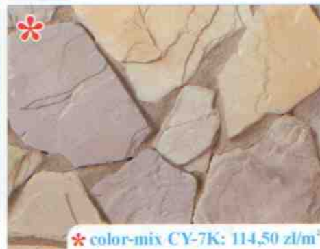
* color-mix CY-7K: 114,50 zł/m 2