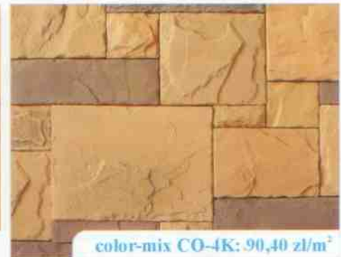
color-mix CO-4K: 90,40 zł/m 2