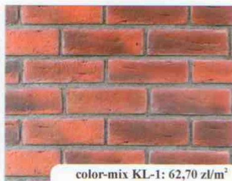
color-mix KL-1: 62,70 zł/m 2