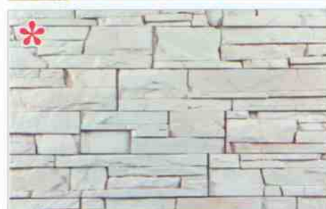
*color-mix CE-2: 105,90 zł/m 2 *color-mix CE-2K: 116,60 zł/m 2