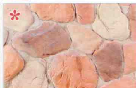
*color-mix OV-2: 82,40 zł/m 2