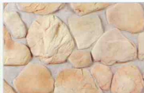
color-mix OV-3: 78,10 zł/m 2