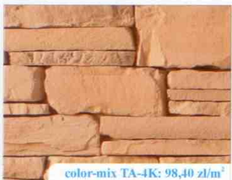
color-mix TA-4K: 98,40 zł/m 2