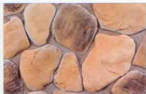
color-mix OV-4: 78,10 zł/m 2