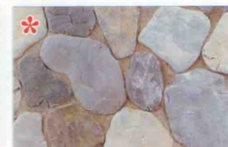
*color-mix OV-6: 87,60 zł/m 2