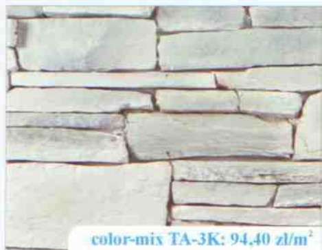
color-mix TA-3K: 94,40 zł/m 2