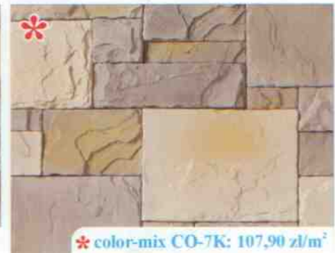
* color-mix CO-7K: 107,90 zł/m 2