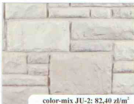
color-mix JU-2: 82,40 zł/m 2