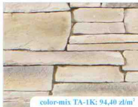
color-mix TA-1K: 94,40 zł/m 2