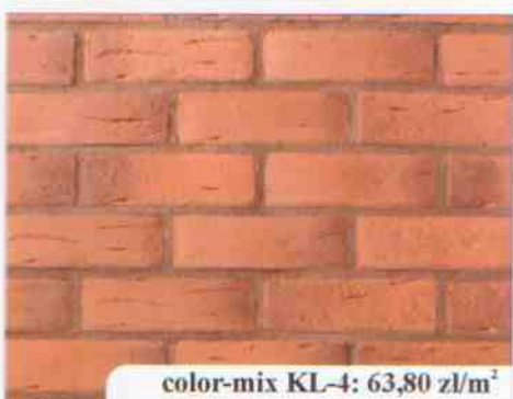
color-mix KL-4: 63,80 zł/m 2