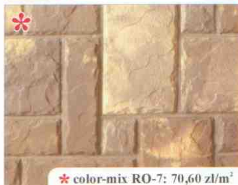
* color-mix RO-7: 70,60 zł/m 2