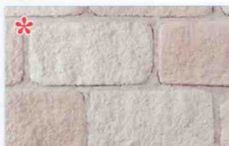
*color-mix MO-2: 83,50 zł/m 2