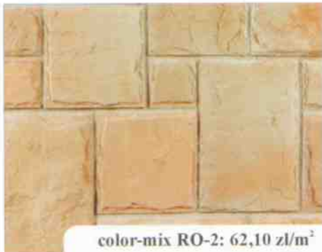
color-mix RO-2: 62,10 zł/m 2