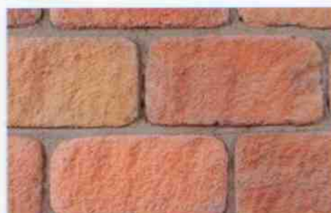
color-mix MO-4: 73,20 zł/m 2