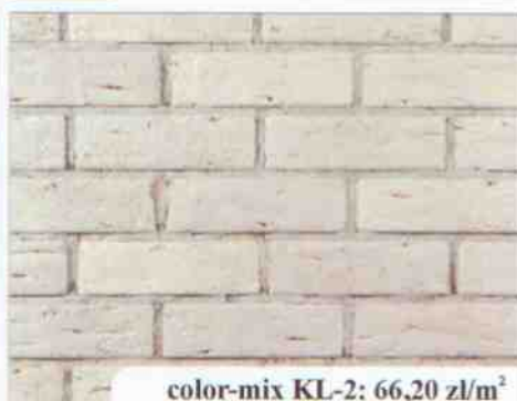
color-mix KL-2: 66,20 zł/m 2