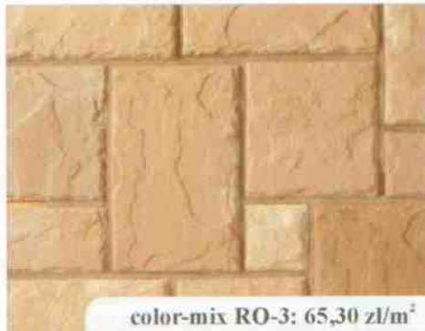
color-mix RO-3: 65,30 zł/m 2