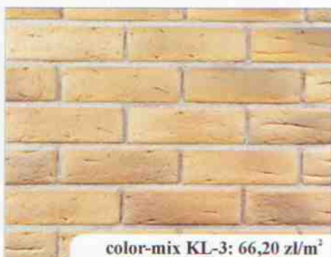
color-mix KL-3: 66,20 zł/m 2