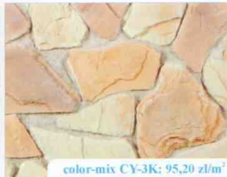
color-mix CY-3K: 95,20 zł/m 2