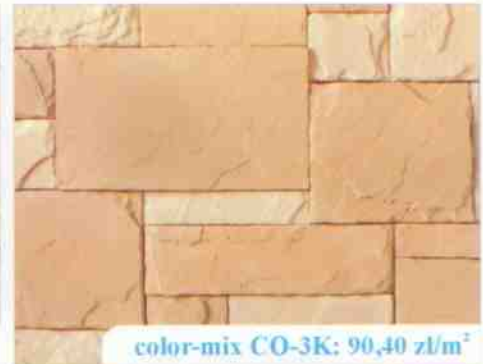
color-mix CO-3K: 90,40 zł/m 2