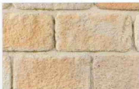
color-mix MO-1: 76,00 zł/m 2