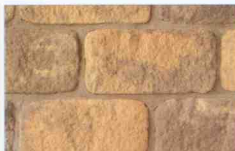
color-mix MO-3: 76,00 zł/m 2