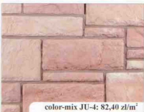
color-mix JU-4: 82,40 zł/m 2