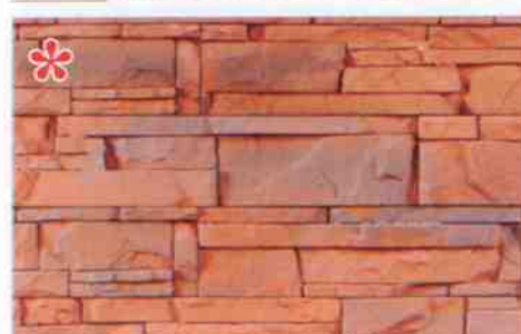
color-mix CE-6: 93,10 zł/m 2 *color-mix CE-6K: 108,30 zł/m 2