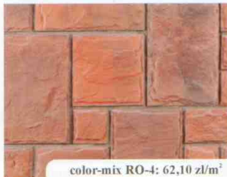
color-mix RO-4: 62,10 zł/m 2